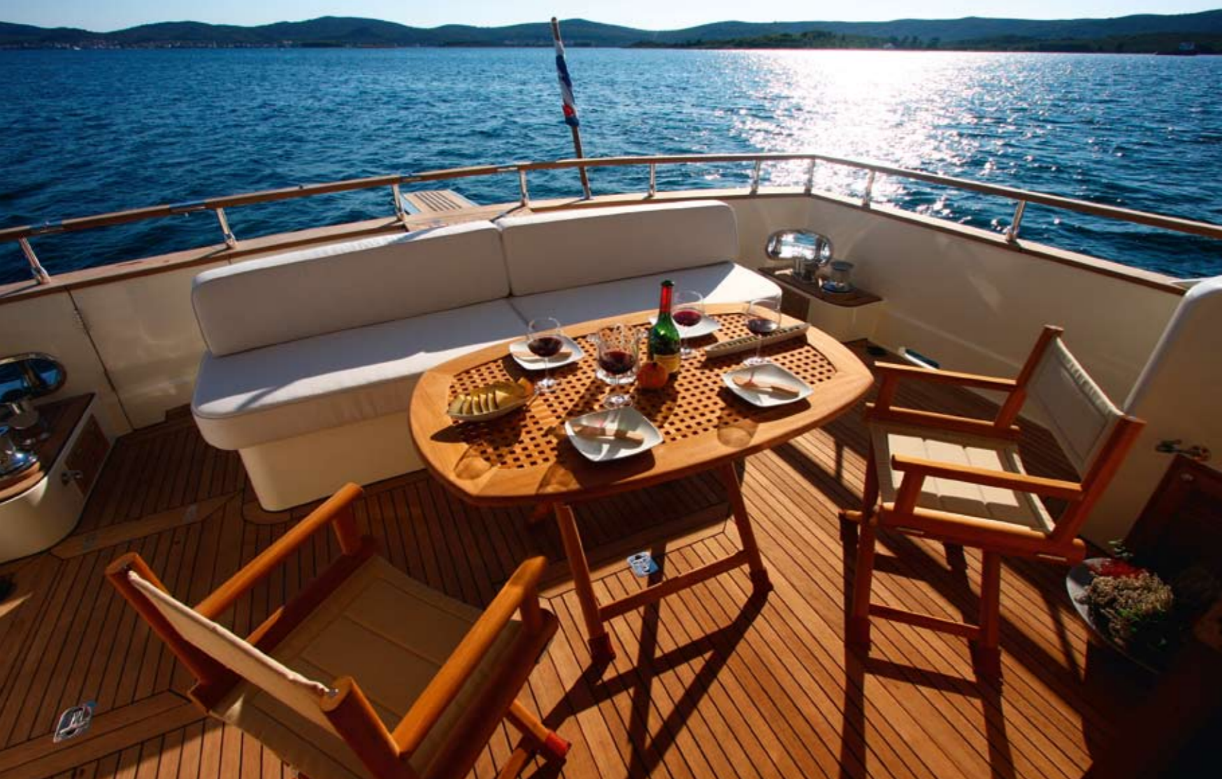
Alaska 53 predstavlja skladan spoj luksuzno-ležerne mediteranske jahte i nepotopive sjevernoameričke ribarice