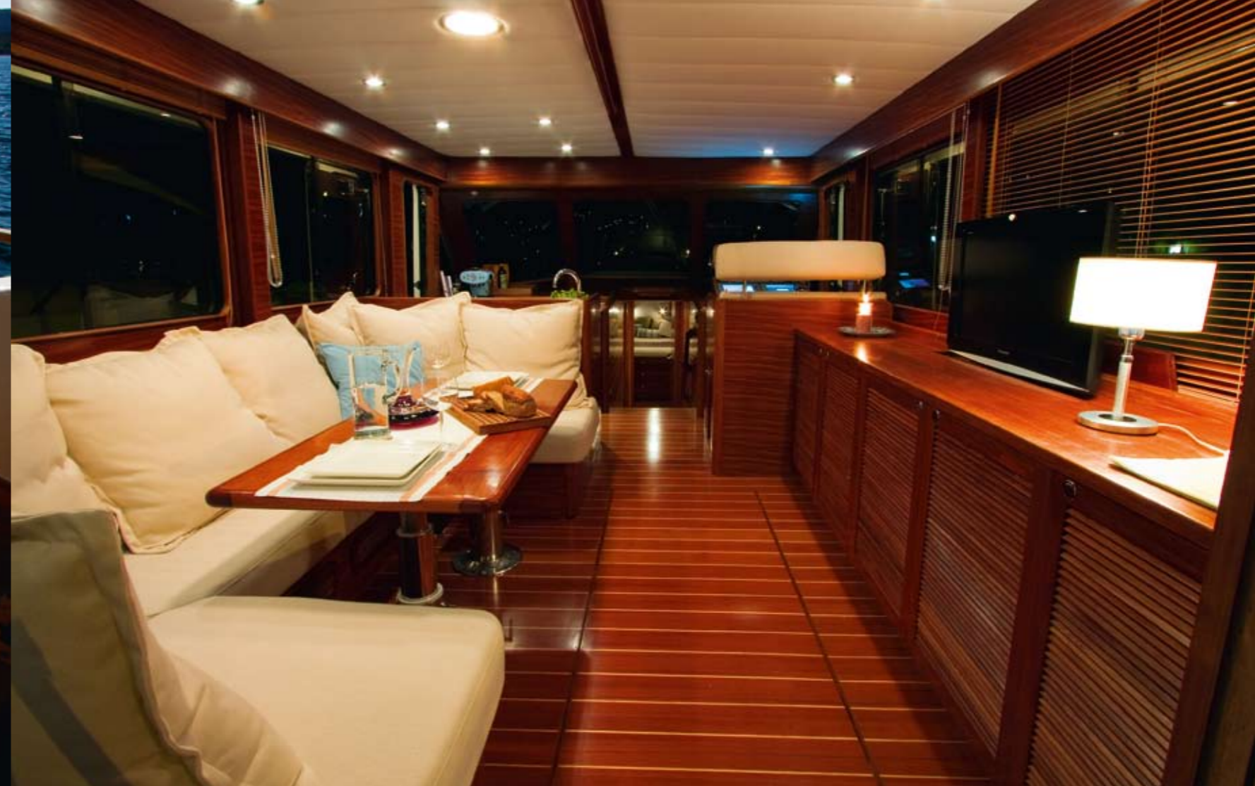
Salonom dominira udobna sjedeća garnitura sa stolom za objedovanje