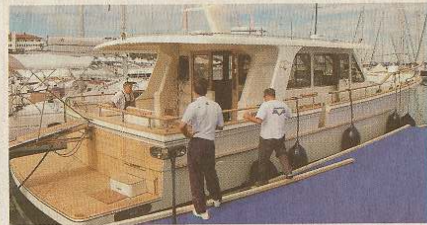
Alaska 53 – Za svetovno premiero je v Izoli poskrbelo zagrebško podjetje Barke Bonom s povsem novo največjo jahto iz serije alaska – klasično po obliki, sodobno po materialih in opremljenosti. 18-metrsko polizrivno barke (dva motorja po 660 KM) s šestimi ležišči so naredili na Kitajskem (DHS, Šanghaj) in jo dokončali v Izoli. Klasika in udobje imata svojo ceno: 800.000 evrov.